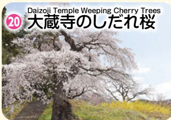
Daizoji Temple Weeping Cherry Trees 20 大蔵寺のしだれ桜