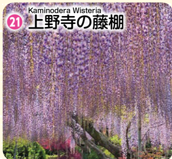
Kamionodera Wisteria 21 上野寺の藤棚

藤が咲き始めると薄紫色の花のカーテンが風に揺られ、甘い香りに包まれる。少人数でゆっくりと鑑賞できる。