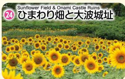
Sunflower Field & Onami Castle Ruins 24 ひまわり畑と大波城址

南北朝時代、吉野朝廷の北畠顕家(きたばたけあきいえ)に従えた大波氏代々の居城「大波城」跡に広がるひまわり畑。「大波ひまわり育て会」が育てるひまわりが、お盆の時期に国道115号線を彩る。