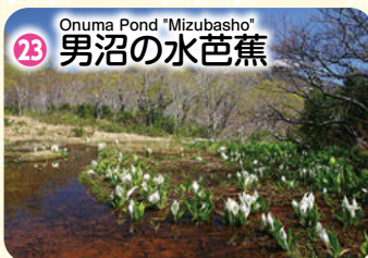
Onuma Pond "Mizubasho" 23 男沼の水芭蕉