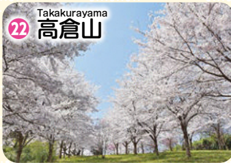
Takakurayama 22 高倉山